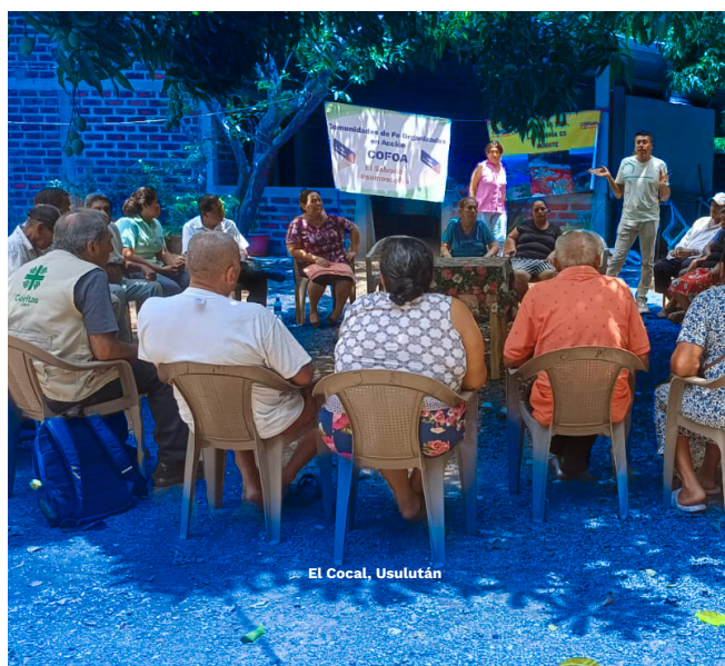
El Cocal, Usulután