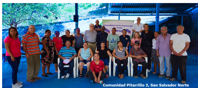
Comunidad Pitarrillo 2, San Salvador Norte