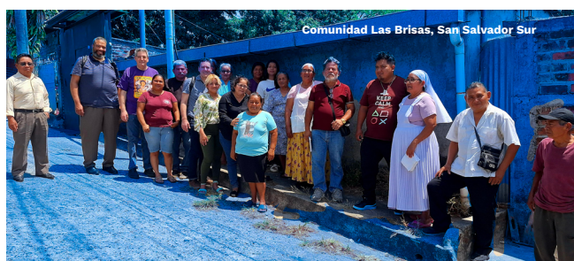
Comunidad Las Brisas, San Salvador Sur