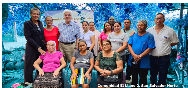
Comunidad El Llano 2, San Salvador Norte