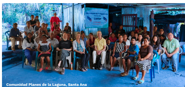
Comunidad Planes de la Laguna, Santa Ana

Miembros de la Junta Directiva de Fe en Acción Internacional, visitaron los comités de organización local en las tres zonas del país: zona central, occidental y paracentral. El propósito de estas visitas fue conocer cómo se aplica la metodología de organización comunitaria de COFOA, y compartir con los líderes un tiempo de preguntas y respuestas para aclarar dudas. Las reuniones fueron muy productivas y se estrecharon lazos de amistad entre líderes y lideresas con la Junta Directiva de Fe en Acción.