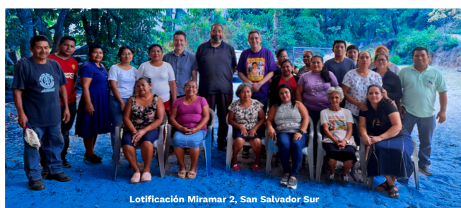
Lotificación Miramar 2, San Salvador Sur