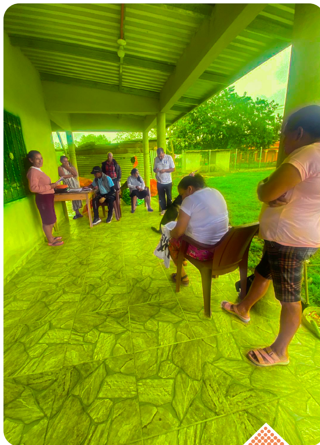
Los líderes y lideresas recibieron un entrenamiento sobre el concepto de investigación y las tres partes de una reunión de investigación.

Los líderes y lideresas conocieron la importancia de la organización comunitaria y se comprometieron a continuar trabajando en beneficio de su comunidad.