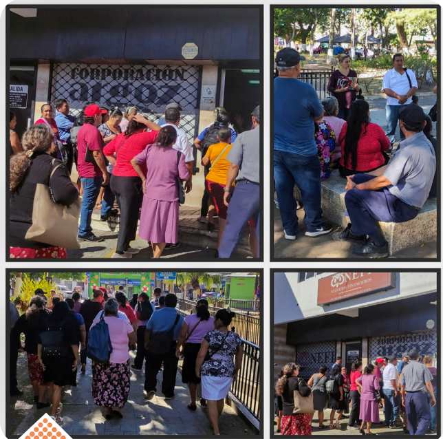
Las comunidades que asistieron son las lotificaciones Encarnación 2, Veracruz 2, El Trébol 1 de Colón; lotificación San Francisco y Las Victorias de San Juan Opico; lotificación Corinto 1 y Corinto 2 de Zaragoza; lotificación Los mangos 1 y Los Palmares del Puerto La Libertad.

informada a las comunidades afectadas. Asimismo, pidieron que se les asignara una fecha para dicho proceso. Para los líderes y lideresas este tipo de acciones fortalecen el trabajo organizativo y el compromiso de continuar luchando por su derecho a una vivienda digna.