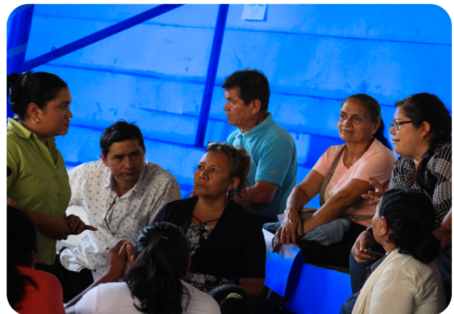
Líderes y lideresas que conforman la campaña RENACER conocieron su situación legal en la adquisición de su título de propiedad.