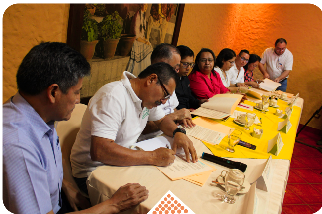
Organizaciones sociales e iglesias que conforman la iniciativa “Causa Raíz de la Migración”, firmaron la carta de compromiso.

Comunidades de Fe Organizadas en Acción (COFOA) en alianza con el Comité de Familiares de Migrantes Fallecidos y Desaparecidos de El Salvador (COFAMIDE), Comité de Familiares de Desaparecidos en El Salvador (COFADES), Comisión de Justicia y Paz de la Conferencia de Religiosos de El Salvador (JPIC CONFRES), Red Franciscana para Migrantes en El Salvador (RFM El Salvador), Misión Cristina Elim, Universidad Centroamericana José Simeón Cañas (UCA) y la Red Scalabriniana, presentaron la iniciativa “Causa Raíz de la Migración en El Salvador” la cual tiene como propósito principal,