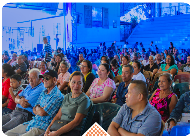
En la reunión asistieron cerca de 240 líderes y se llevó a cabo en las instalaciones de la Parroquia San Antonio de Padua en San Salvador.

Recordemos las palabras del Señor Jesús “Dando es como se recibe”.