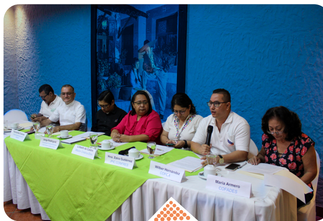
Ponentes presentando los rubros en los que se trabajó que comprende la iniciativa.

incidir fundamentalmente en las políticas económicas, migratorias, de Derechos Humanos y de desarrollo en la región. Las organizaciones e iglesias que conformamos esta iniciativa creemos fielmente en la dignidad de cada persona y somos conscientes de las injusticias cometidas contra las comunidades indígenas y pobres ya que, trabajamos para abordar las causas profundas de la pobreza, la violencia y la corrupción que obligan a las personas a abandonar sus hogares en la región y verse forzadas a migrar a otros países en busca de una vida mejor para ellos y sus familias.