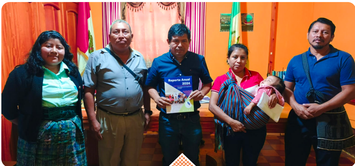
Los líderes hicieron entrega del reporte anual 2024 al Alcalde Eswin Buch para difundir el trabajo de COFOA.

Al finalizar la reunión, los líderes manifestaron sentirse satisfechos con los resultados obtenidos los cuales son fruto de la organización comunitaria de COFOA.