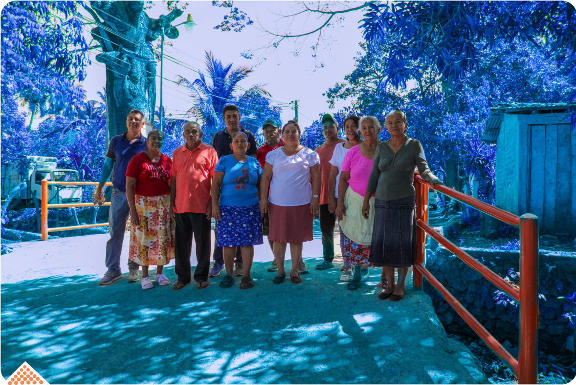
Líderes y lideresas de El Cocal se organizaron para la construcción del puente de acceso principal.