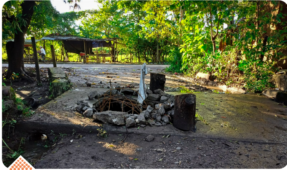
Cárcava del puente anterior que impidió el acceso a la comunidad por 22 días.

La obra tenía inicialmente un costo de $6.500, lo que hizo que líderes y lideresas comenzaron a gestionar fondos por todos lados, hicieron vendimias, rifas, colectas. Solicitaron fondos a hermanos lejanos, a cooperativas de ahorro como Credicampo quien les donó material de construcción a la Ferretería “El Río, que les prestó la maquina removedor de tierra sin costo alguno y les donaron material para la construcción. La ayuda recolectada sumó un total total de $7,000 dólares.