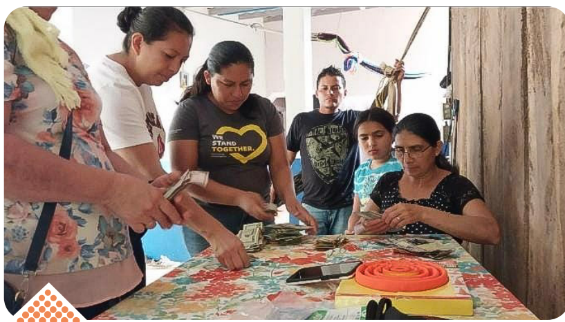
Lideresas activas de El Porvenir realizaron el conteo de fondos recaudados por la comunidad.